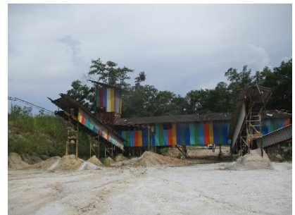
โรงไม้หินของโครงการ