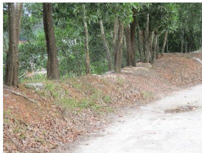
คันทำนบดิน