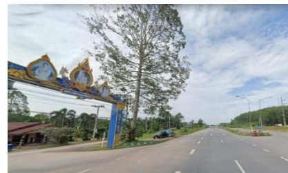
ทางหลวงหมายเลข 41