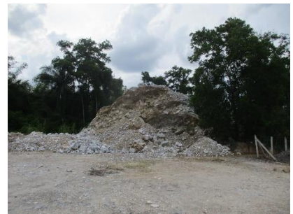
พื้นที่เก็บกองเปลือกดิน