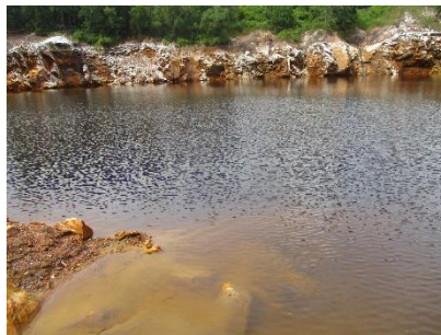
บ่อขุมเหมือง