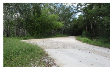
เส้นทางคมนาคมเข้า-ออกพื้นที่โครงการ