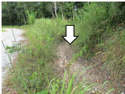
คูระบายน้ำ