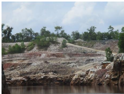
พื้นที่หน้าเหมือง